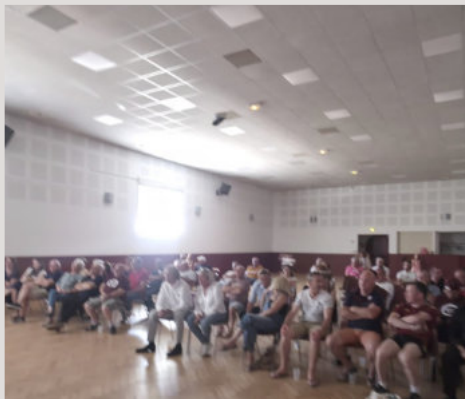
RETRANSMISSION FINALE RUGBY, COMITÉ DES FÊTES - 23 mai