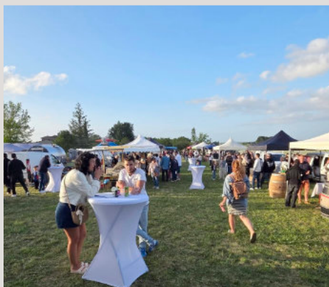
FÊTE DU VIN, COMITÉ DES FÊTES 6 juin