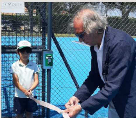
INAUGURATION COURTS DE TENNIS 7 juin

« Saint Germain du Puch rate d'un rien la montée en N1 [...]»