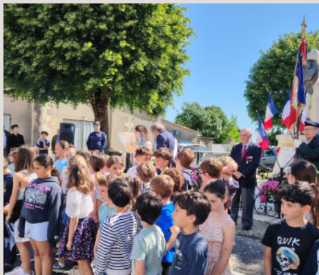
COMMÉMORATION 8 mai