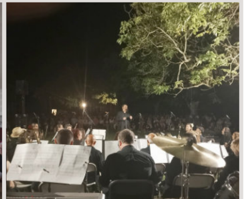
MUSIQUE À ST GERMAIN, MAIRIE 23 mai