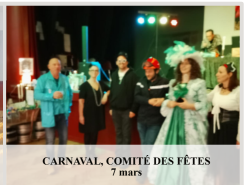
CARNAVAL, COMITÉ DES FÊTES 7 mars