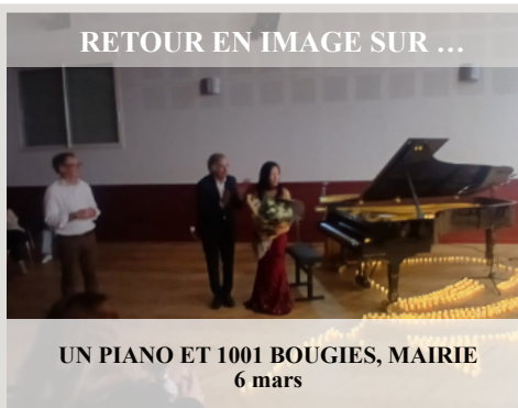
UN PIANO ET 1001 BOUGIES, MAIRIE 6 mars