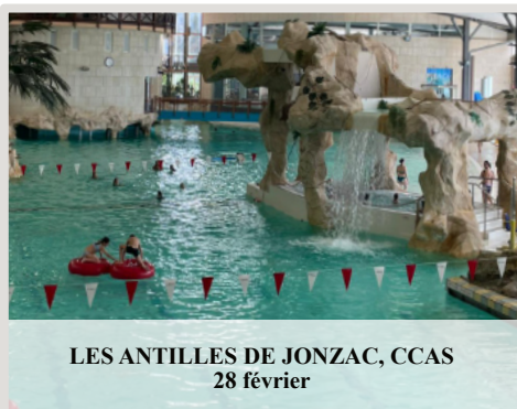
LES ANTILLES DE JONZAC, CCAS 28 février

Entrée libre – venez nombreux faire vibrer Saint-Germain-du-Puch !