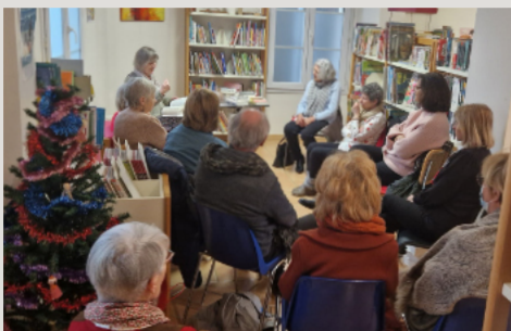
RENTRÉE LITTÉRAIRE BIBLIOTHÈQUE 10 janvier