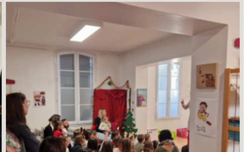
ATELIER DE NOËL BIBLIOTHÈQUE 13 décembre