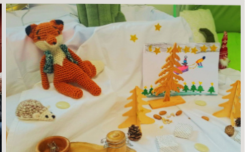
CONTES BIBLIOTHÈQUE 19 et 24 janvier