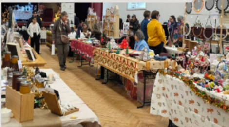
MARCHÉ DE NOËL LES LOUPIOTS 7 décembre