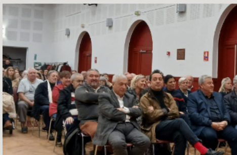
VŒUX DU MAIRE 16 janvier