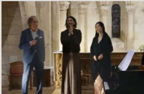
CONCERT AÉRO 12 décembre